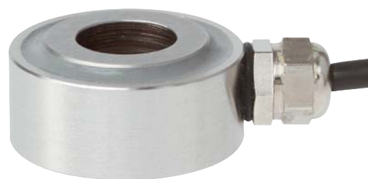
Тензодатчик с элементом в виде кольца, Модель F6210