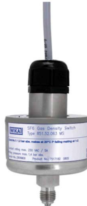
Реле плотности газа, модель 851.52.063 MS

Между 2 контактами: \geq 50 мбар Гистерезис переключения: как правило, 50 мбар