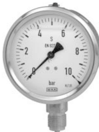
Манометр с трубчатой пружиной Модель 213.53, Присоединение снизу