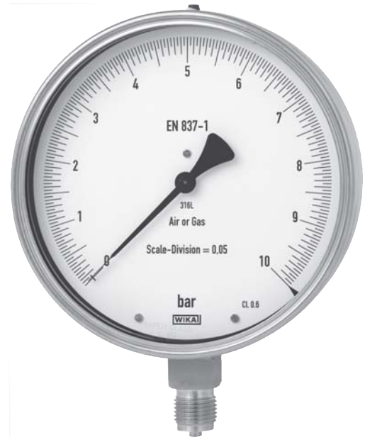
Серия тестовых манометров, Модель 332.50