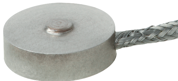
Миниатюрный компрессионный датчик силы, модель F1222