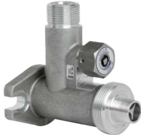
Газонепроницаемое соединение, модель GLTC10 – 3-ходовый комбинированный клапан