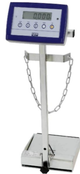
Переносные весы для газового баллона (элегаз SF 6 ), модель GWS-10