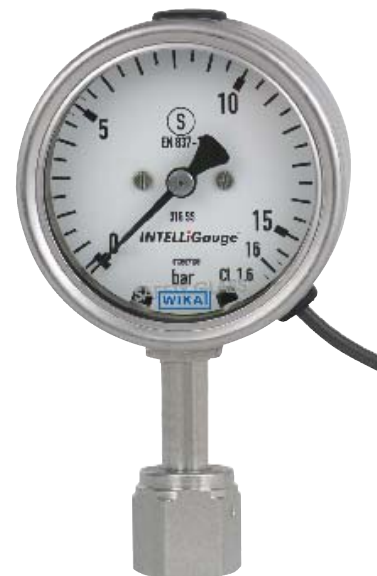
intelliGAUGE, модель PGT23.063, для СЧС (сверхчистые среды)

PGT23.063 UHP выполнен на базе высококачественного манометра из нержавеющей стали, безопасного исполнения, модели 23x.30, номинальный размер 63, в соответствии с EN 837-1.